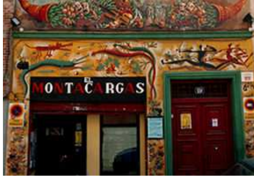
SALA EL MONTACARGAS

Venía la prueba de fuego como era el representarla ante un público más allá de su amigos. La Sala Montacargas le ofreció el poder representarla para que los programadores vinieran a verlo.